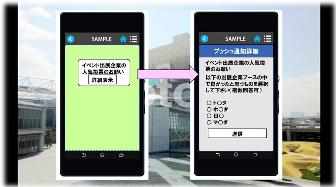
図2 Polaris_EV アプリでのアンケート受信画面イメージ